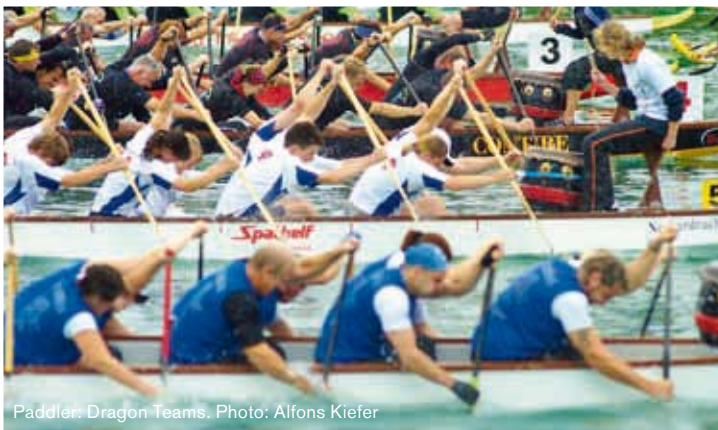
Paddler: Dragon Teams.

Das extrem robuste Drachenboot-Trainingspaddel. Sehr preiswert und enorm verschleißfest. Ovalisierter Schaft. Extremely tough dragon-boat paddle for training and fun. High value, low price. Ovalized shaft.